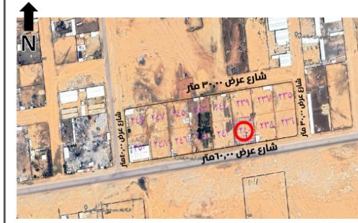
الموقع بالنسبة للمخطط :